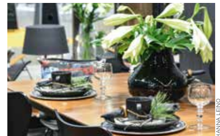
Kevätmessut 2018. Terassi Median osasto.

Oikeus mediatietojen ja siinä esitettyjen tietojen muutoksiin pidätetään. Ilmoitusten muut ehdot saatavana mediamyynnistä. Peruutus viimeistään 7 pv ennen aineistopäivää, sen jälkeen voidaan laskuttaa hinnaston mukainen ilmoitushinta/yhteistyölle vahvistettu muu hinta. Mahdolliset reklamaatiot 14 pv kuluessa julkaisusta/sovitusta yhteistyöstä kirjallisena. Lehden vastuu virheistä rajoittuu enintään maksetun ilmoitus-/yhteistyöhinnan palauttamiseen. Aineistopäivän noudattamisesta ja aineiston oikeellisuudesta vastaa ilmoittaja.