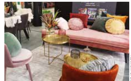
Habitare 2018. Terassi Median osasto.

Kerro tarina tuotteestasi ja sen käytöstä!